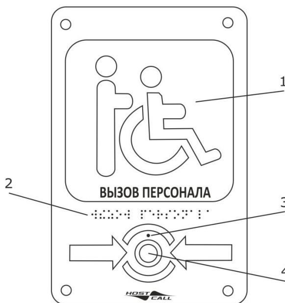
Рисунок 1. Внешний вид радиокнопки вызова МР-413W14

На рис.1 приведен внешний вид радиокнопки вызова.