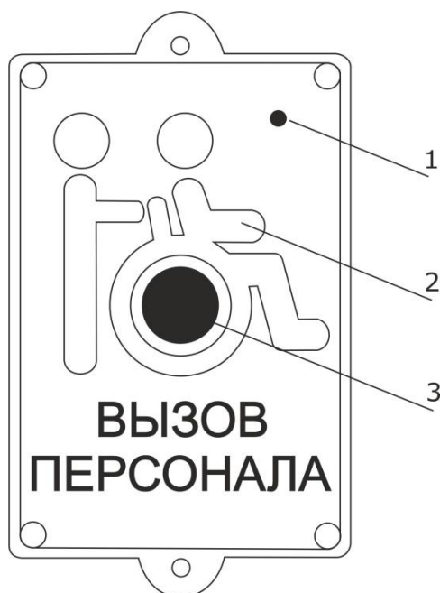
Рисунок 1. Внешний вид радиокнопки вызова МР-413W13

На рис.1 приведен внешний вид радиокнопки вызова.